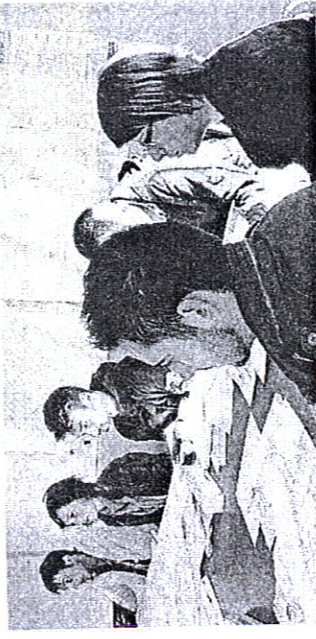
Les étudiants ont reçu pour mission l'aménagement du hall et du club-house de la salle multisports Les Olympiades.